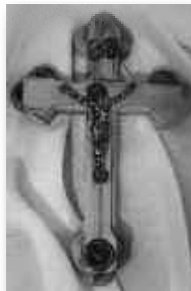
Διάσταση 13cm x 8.50cm

Διαθέτουμε ξύλινους σταυρούς από τὰ Ἱεροσόλυμα πού περιέχουν κῶμα ἀπό τήν ἁγία Γῆ . Ἐπίσης ὁ σταυρός πού βλέπετε δεξιά ἔχει στά τέσσερα σημεῖα του, λιβάνι, πέτρα, κῶμα καί σταυρολούλουδο ἀπό τήν Ἁγία Γῆ.